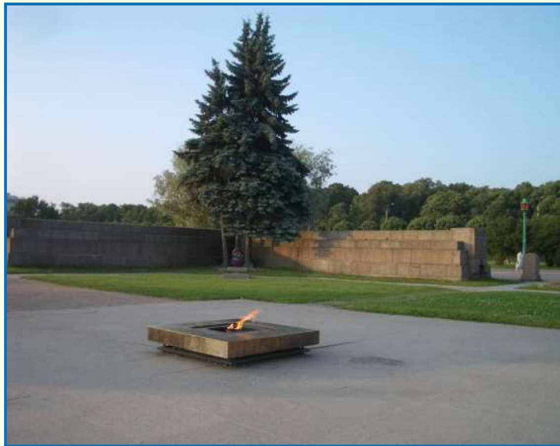
Вечный огонь на Марсовом поле. г. Ленинград (ныне г. Санкт-Петербург)

Мемориальный архитектурный ансамбль «Могила Неизвестного солдата» был торжественно открыт в День Победы – 8 мая 1967 года. А накануне этого события, 7 мая 1967 г. факел Вечного огня зажгли от пламени, пылающего на Марсовом поле в г. Ленинграде. Нужно сказать, что вечный огонь в центре мемориала на Марсовом поле был зажжён 6 ноября 1957 года и был первым в нашей стране.